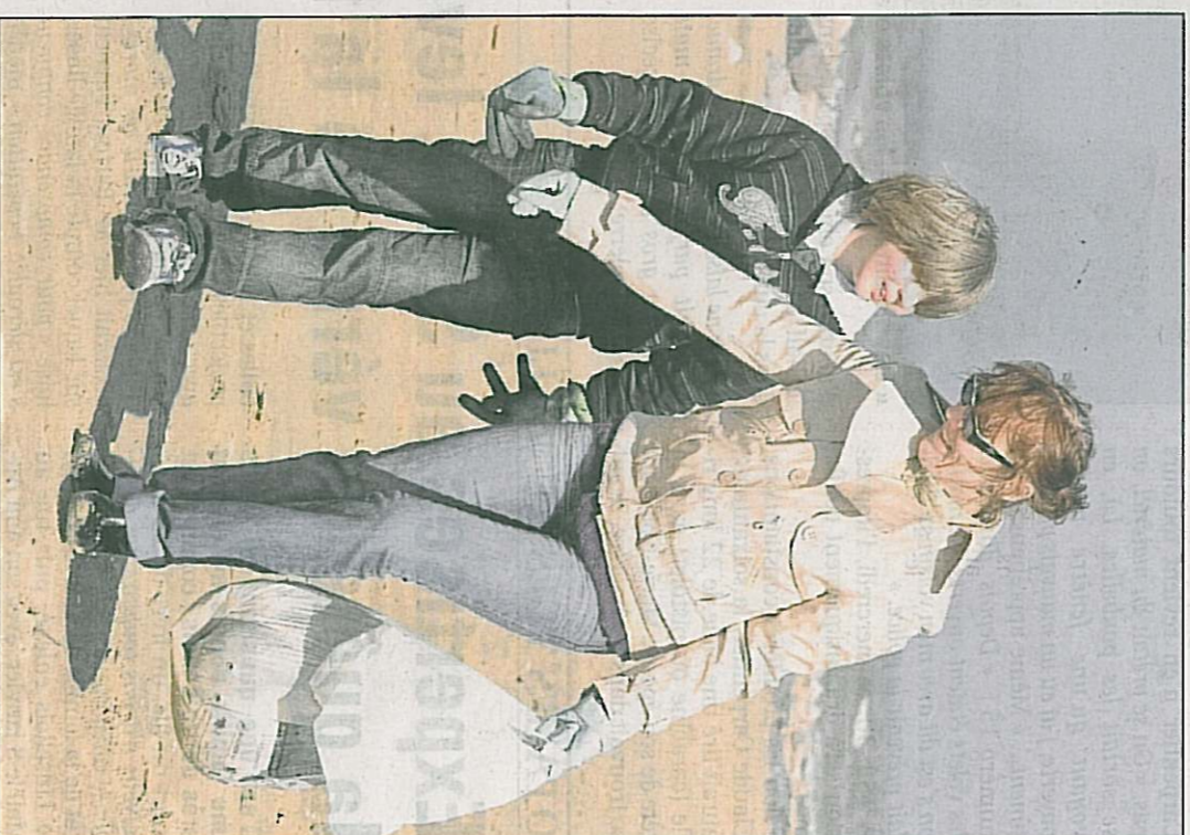
La satisfaction du devoir accompli au bénéfice de la collectivité fait oublier le poids du sac sur le chemin du retour.

Au gré de ses découvertes, son sac à elle devient de plus en plus pesant. Heureusement, à l'inverse de l'année dernière, elle n'a pas trouvé de « barrière métallique »... ■